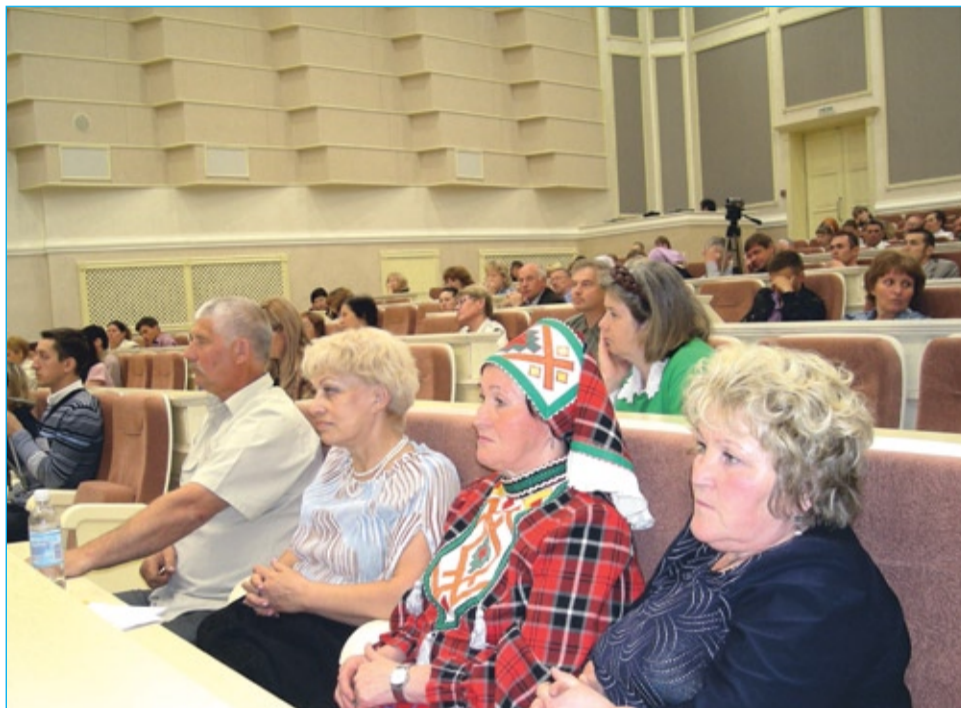
На снимке: На республиканской конференции «Общее дело – за трезвую Удмуртию» равнодушных не было

Я забыл про вино и табак, Стало легче и радостней жить. Раньше выпить я был не дурак, А теперь не дурак, чтобы пить!