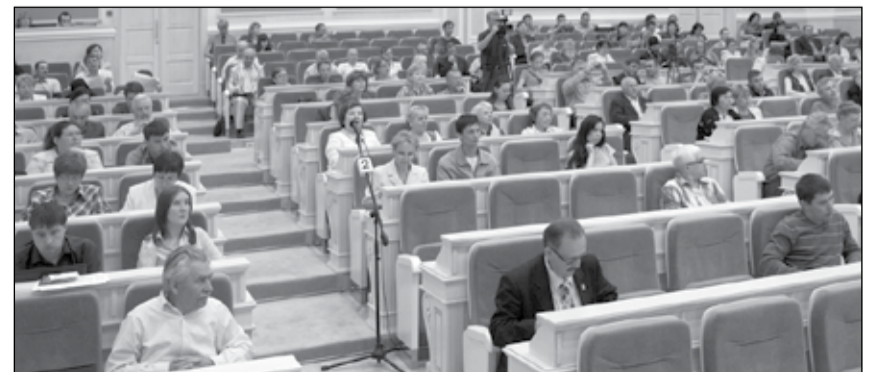
На снимке: В зале заседаний Государственного Совета УР