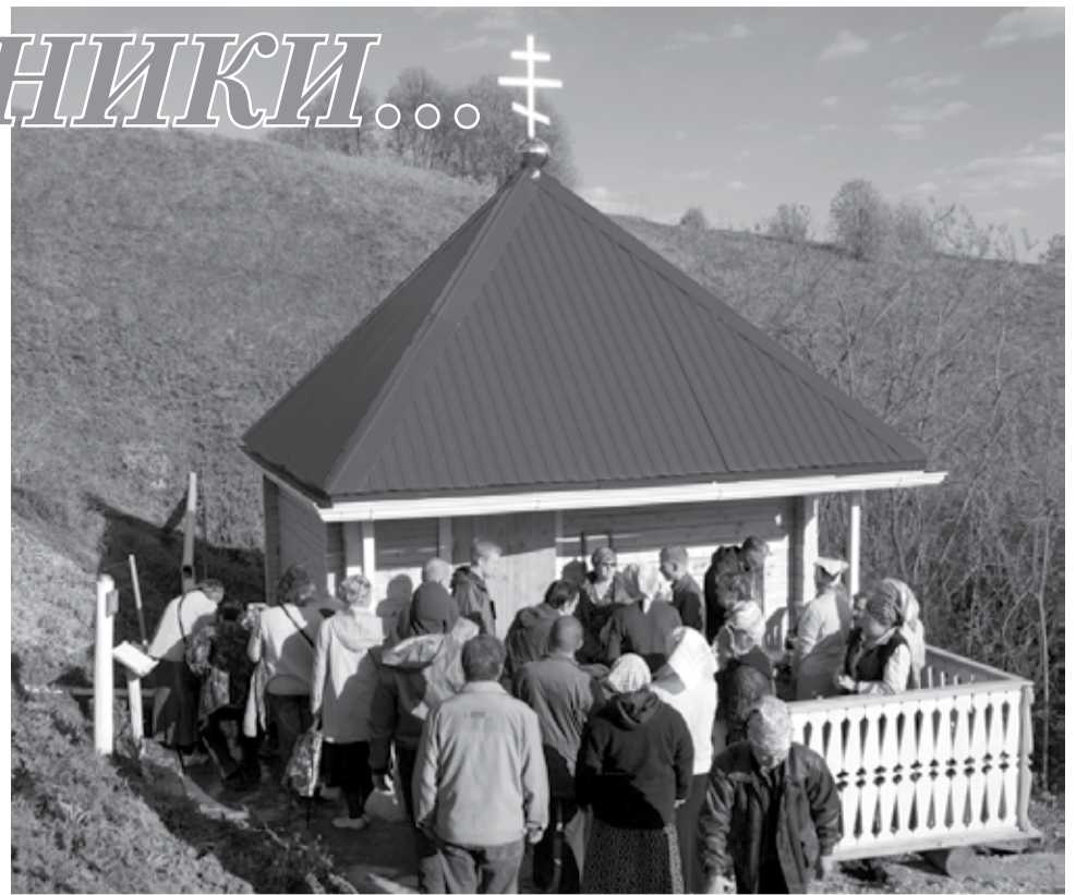
На снимке: Купальня в Кельчино

Обычно наблюдается следующий эффект: сразу после омовения, независимо от температуры окружающей среды, вы начинаете ощущать, как кожа начинает «гореть». Тело как бы обволакивает кокон из внутреннего жара. Этот эффект может наблюдаться от нескольких минут до десятков минут после купания в святом источнике. Кожа как будто очищается от какого-то «налета». Возможно, вы ощутите, что тело приобрело легкость. Кто-то почувствует, что голова стала легче и исчезло напряжение в шее, у кого-то легче станут руки, кому-то станет легче ступать по земле. Вероятно, через некоторое время вы обратитесь к своим мыслям и заметите, что их словно кто-то «пригладил». Если ваша душа подготовлена, то вы ощутите состояние, которое можно описать словом «благодать». А кто-то через некоторое время сможет получить простые ответы на важные вопросы.