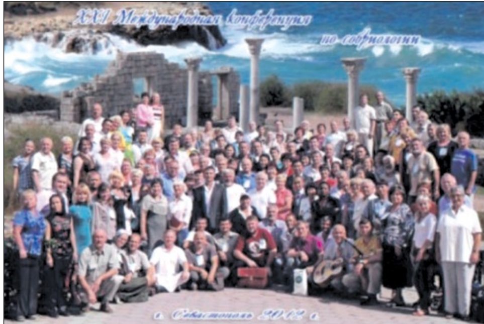
На снимке: Участники Международной конференции по собриологии, профилактике, социальной педагогике и алкологии

Пусть будут каждому из нас дороги обращения соратников: «СПЕШИТЕ ДЕЛАТЬ ДОБРО! ВЫБРАЛСЯ САМ ИЗ ГРЯЗИ ДУРМАНА – ПОМОГИ ДРУГОМУ! ЕСЛИ НЕ Я, ТО КТО ЖЕ?»