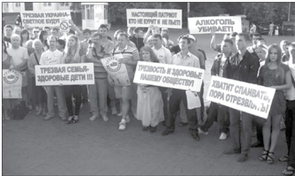
Основная задача молодых трезвенников, освобождение общества от алкогольной, табачной и другой наркотической зависимости