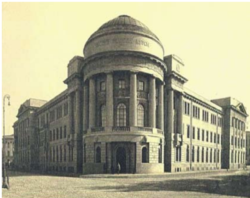
Здание Высших женских курсов, на Девичьем поле. Фотография 1915 года.