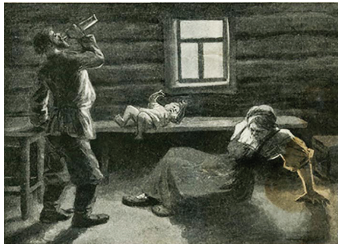
Еще одна иллюстрация из альбома Д. Булгаковского под названием «Тяжелая картина». Как и все другие иллюстрации сопровождалась назидательной подписью.

Деятельность российских трезвенников вызвала ин-