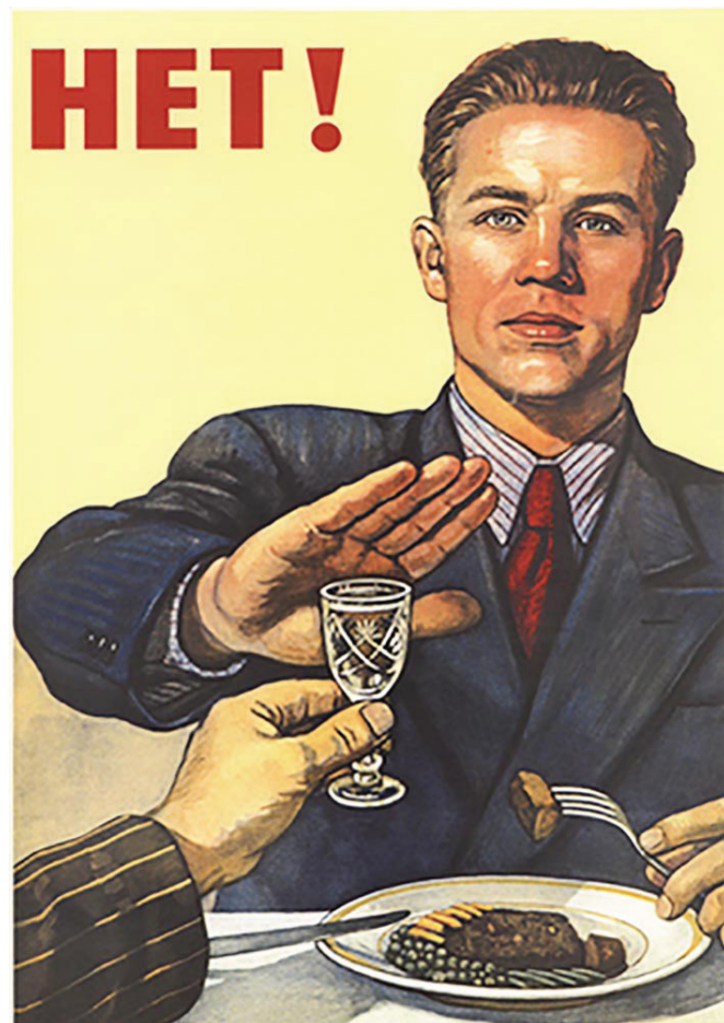
Один из популярных в СССР антиалкогольных плакатов — «Нет!» В. Говоркова. 1954 г.

Было принято и Положение о медицинском вытрезвителе: «медицинский вытрезвитель... является специализированным учреждением милиции, выполняющим функции пресечения нарушений антиалкогольного законодательства, и, в частности, появления в общественных местах лиц, находящихся в состоянии опьянения, если их вид оскорбляет человеческое достоинство и общественную нравственность или если они утратили способность самостоятельно передвигаться либо могли причинить вред окружающим или себе, и оказания им неотложной медицинской помощи».