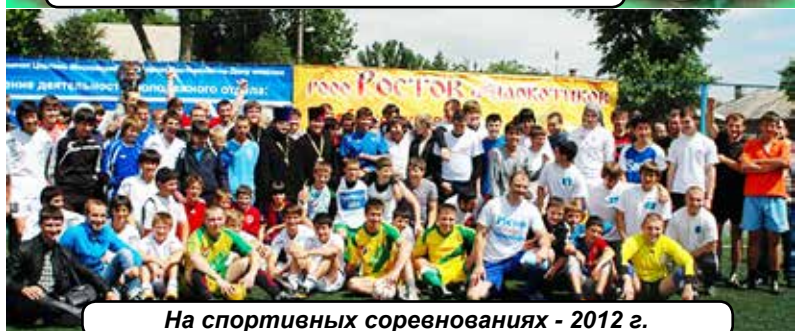
На спортивных соревнованиях - 2012 г.