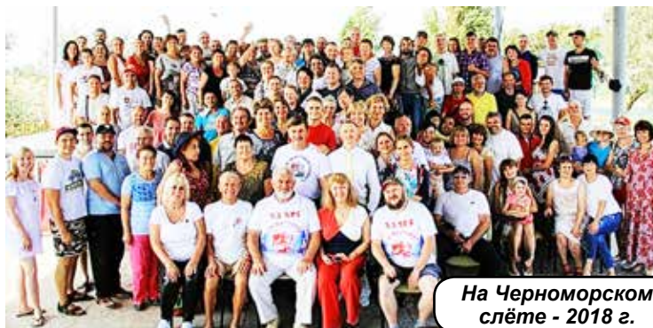
На Черноморском слёте - 2018 г.