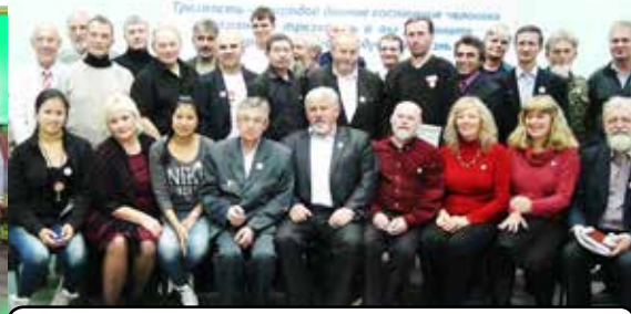
Участники совместного съезда - 2013 г.