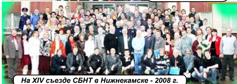
На XIV съезде СБНТ в Нижнекамске - 2008 г.