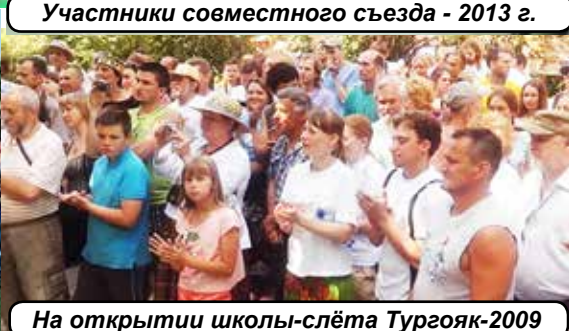
На открытии школы-слёта Тургойак-2009

Адрес редакции: 655138, п. Расцвет, ул. Майская, 5 – 2, т. (913)445-59-06