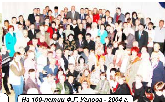
На 100-летию Ф.Г. Углова - 2004 г.