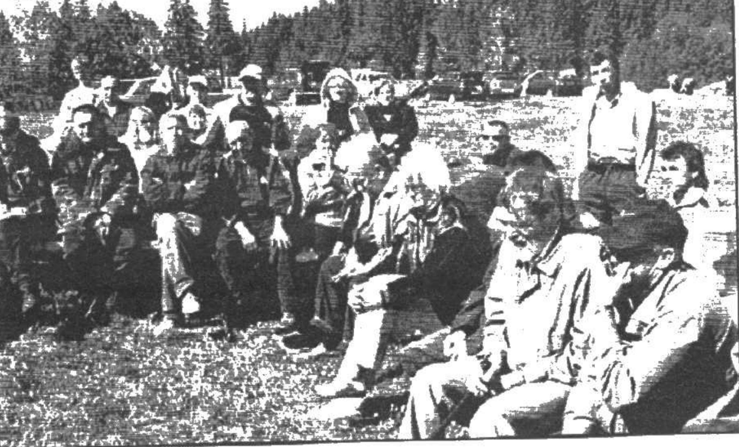
Обсуждается важное решение