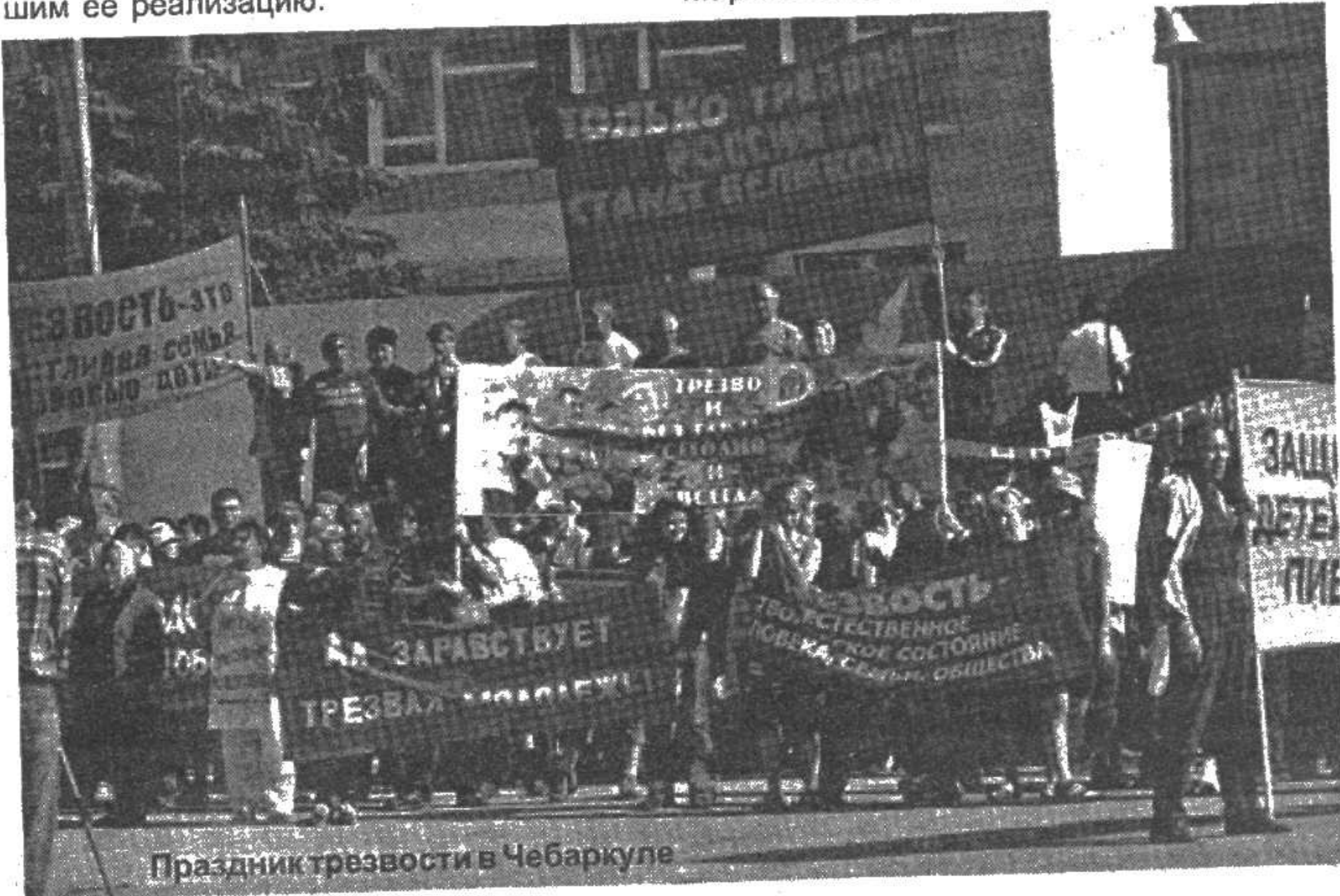
Праздник трезвости в Чебаркуле