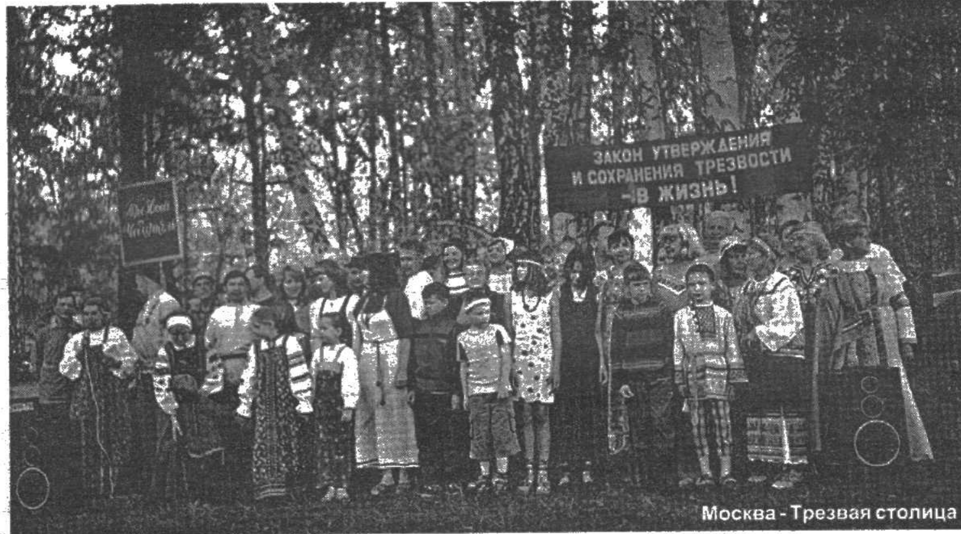
Москва - Трезвая столица