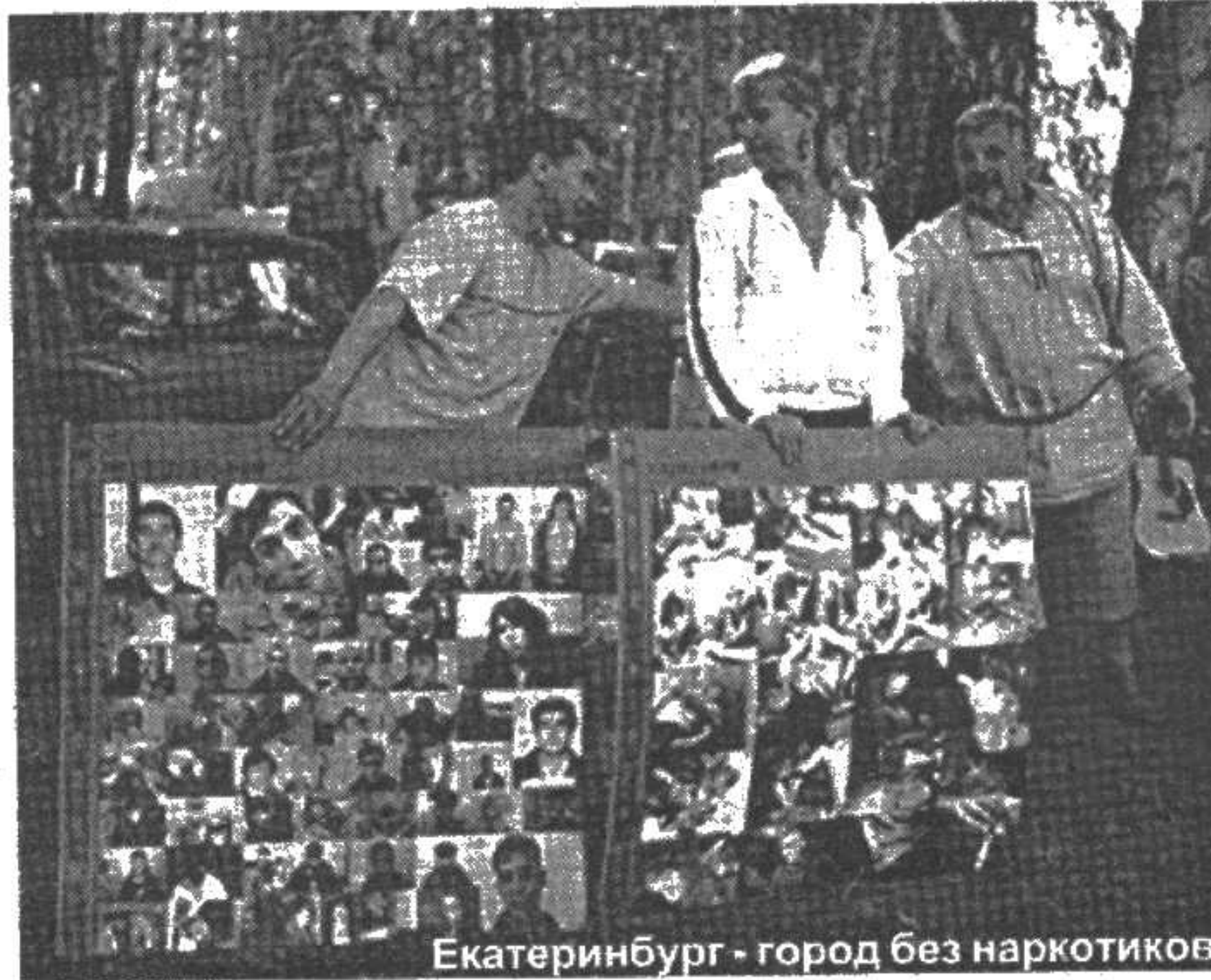
Екатеринбург - город без наркотиков

котиков», только что вышедшая из печати. Советуем всем клубам и организациям приобрести этот фолиант и использовать как пособие в борьбе с наркомафией. В настоящее время «Трезвый Екате-