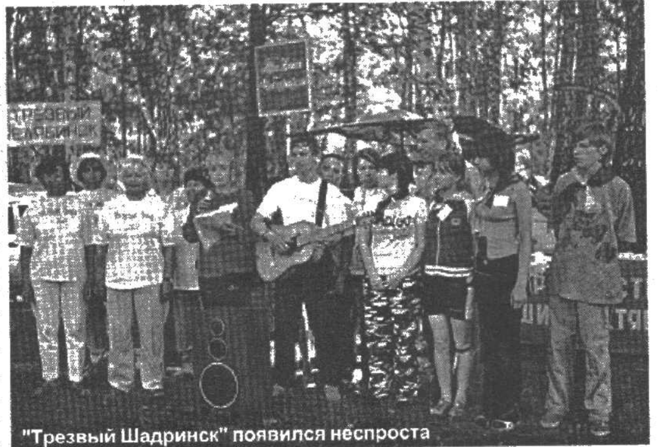
"Трезвый Шадринск" появился неспроста

Нельзя не упомянуть еще об одной интересной делегации, прибывшей, видимо, тоже с опозданием. Это делегация Синарского трубного завода (МинТЗ) из города Каменск-Уральского. С завода и из города, где на деле реализуются заводская и городская программы на оздоровление людей. Возглавлял делегацию известный нашим читателям по публикаци-