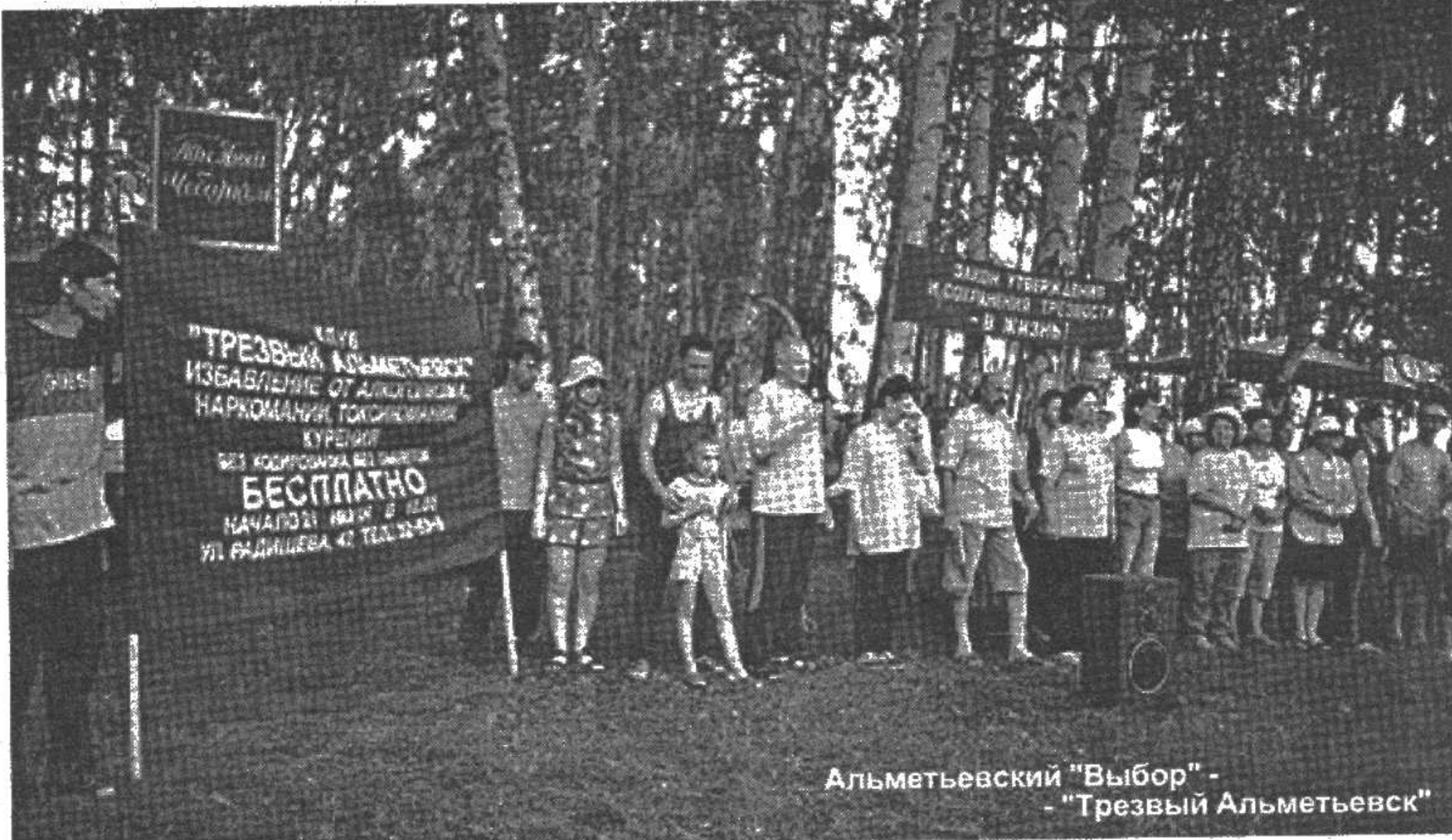
Альметьевский "Выбор" - "Трезвый Альметьевск"

тавить слово всем незарегистрировавшимся и только что подъехавшим делегатам.