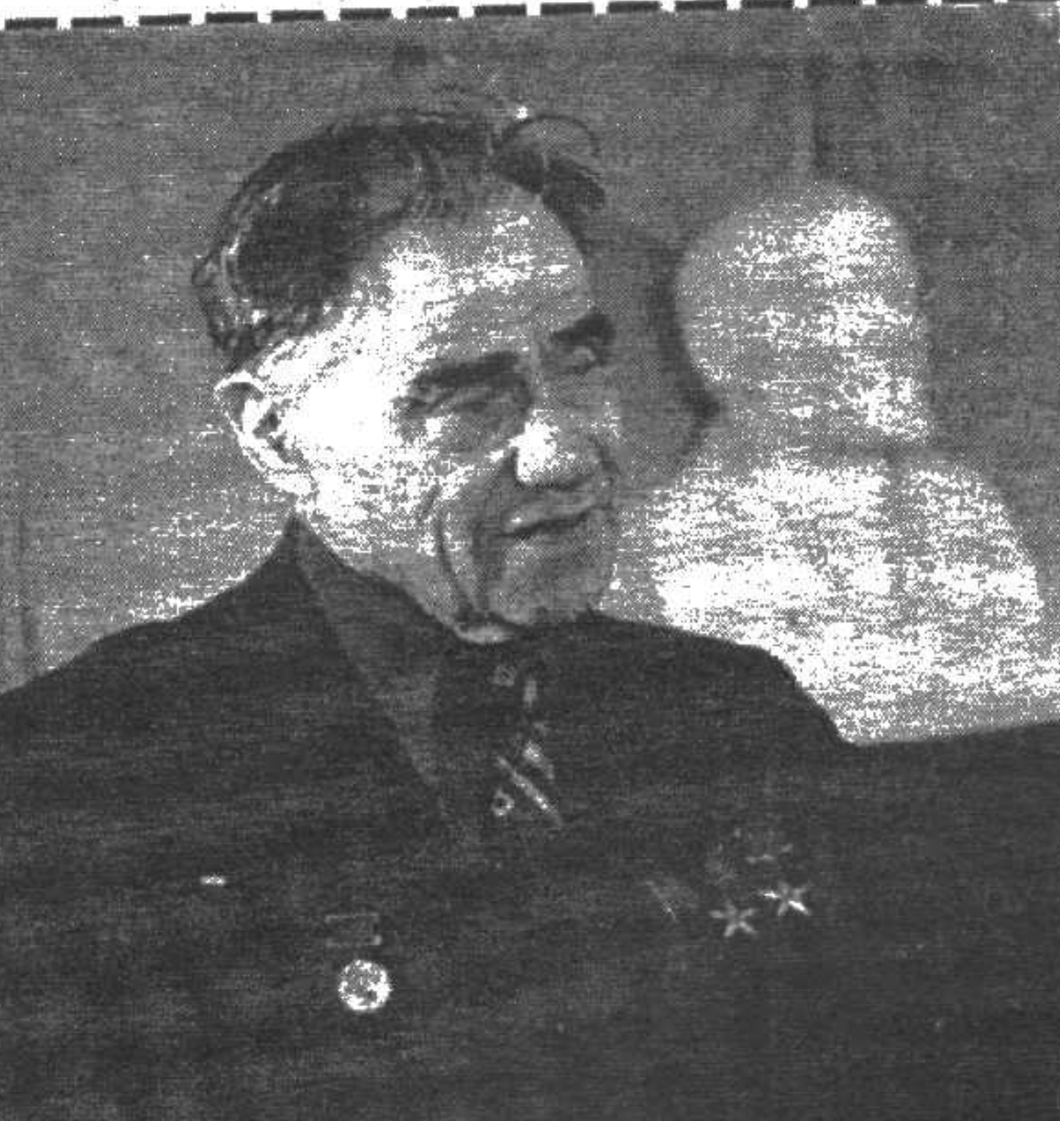
Т. С. МАЛЬЦЕВ , почетный академик ВАСХНИЛ, дважды Герой Социалистического Труда, депутат Верховного Совета РСФСР, директор Шадринской опытной станции, полковник колхоза «Заветы Ленина» Сибирского отделения ВАСХНИЛ

В детстве отец часто наказывал мне: не пить, не курить, охотничье ружье в руки не брать, в карты не играть. Теперь мне идет 91-й год, и я счастлив, что наказам родителя старался быть верным всю свою жизнь. И поэтому не мог, не могу и не смогу никогда равнодушно смотреть на тот материальный и моральный ущерб, который причиняет нашему обществу отвратительное явление – пьянство. Известно, что верные спутники пьянства – это стяжательство, воровство, прогулы, хулиганство. Убежден, что многие недостатки в нашей жизни происходят главным образом как раз из-за этого позора человеческого. А уж о несчастных и разрушениях семей и говорить нечего. Мне как депутату Верховного Совета РСФСР и члену Курганского обкома КПСС часто приходится читать письма об этом. В горе и отчаянии пишут матери, дети. Просят помочь, оградить их семьи от пьяниц.