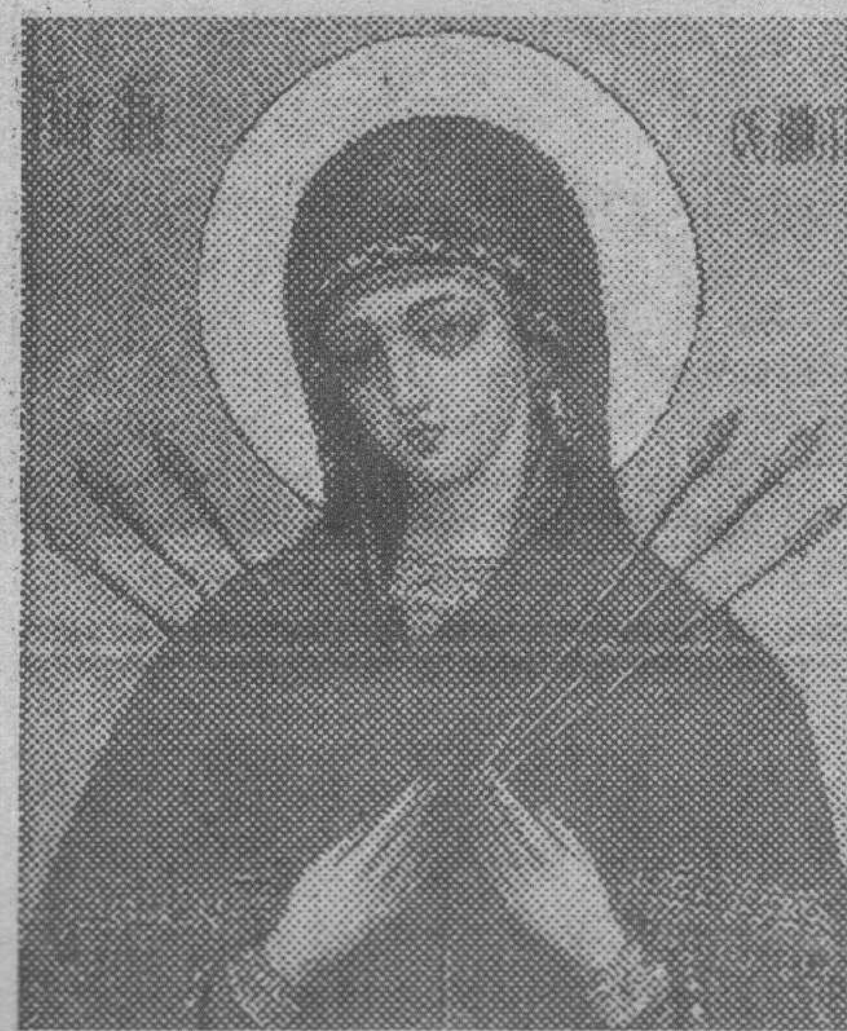
"Умягчение злых сердец" ("Семистрельная")

Трагедия русского города — Буденновска — имеет невидимую духовную сторону. О ней почему-то не говорят. Но разве случайно, что боевики избрали для нападения город с названием "Святой Крест"? И разве не удивительно, что захваченная боевиками больница находится на территории бывшего монастыря, который связан с памятью кавказского Первомученика — благоверного князя Михаила Тверского?