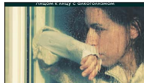
Помощь и надежда для семей и друзей алкоголиков