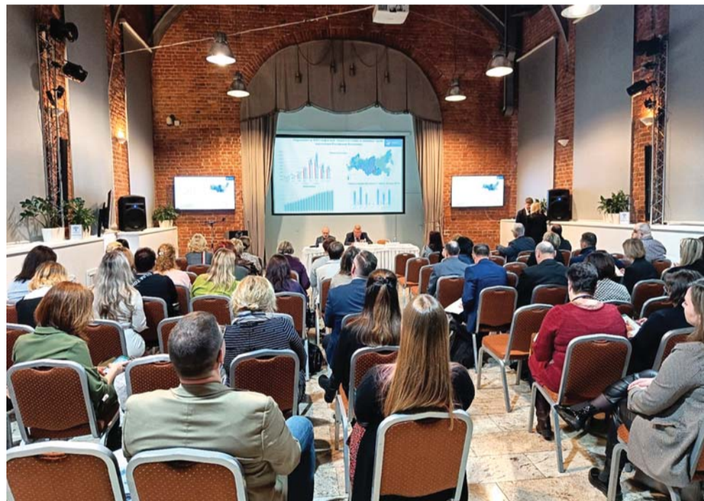
Фото с конференции по наркомании

Телефон горячей линии По вопросам реабилитации + 7 (921) 916-92-24