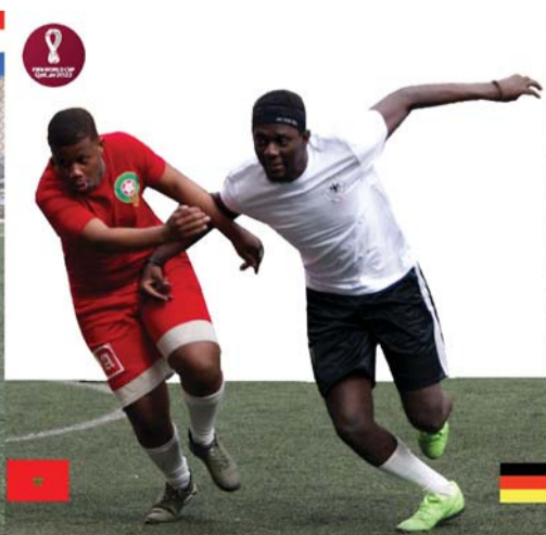
Лефрика vs Яссир